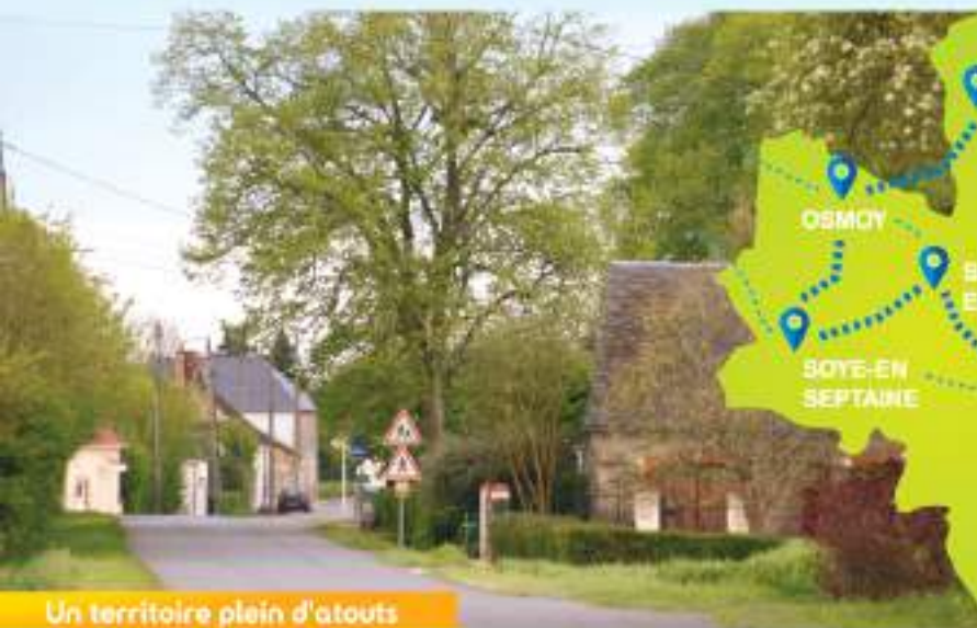
Un territoire plein d'atouts

Les 15 communes qui constituent La Septaine possèdent toutes des atouts touristiques parfois méconnus . Laissez-vous guider à la découverte des richesses du territoire.