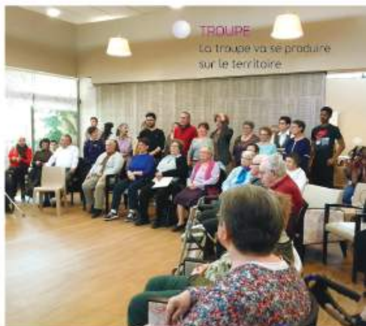
TROUPE La troupe va se produire sur le territoire

Enfin, le mardi 9 juillet, à partir de 15h, le chœur sera au complet pour son traditionnel spectacle donné à l'EPIDE d'Osmoy : "La balade musicale de gens heureux".