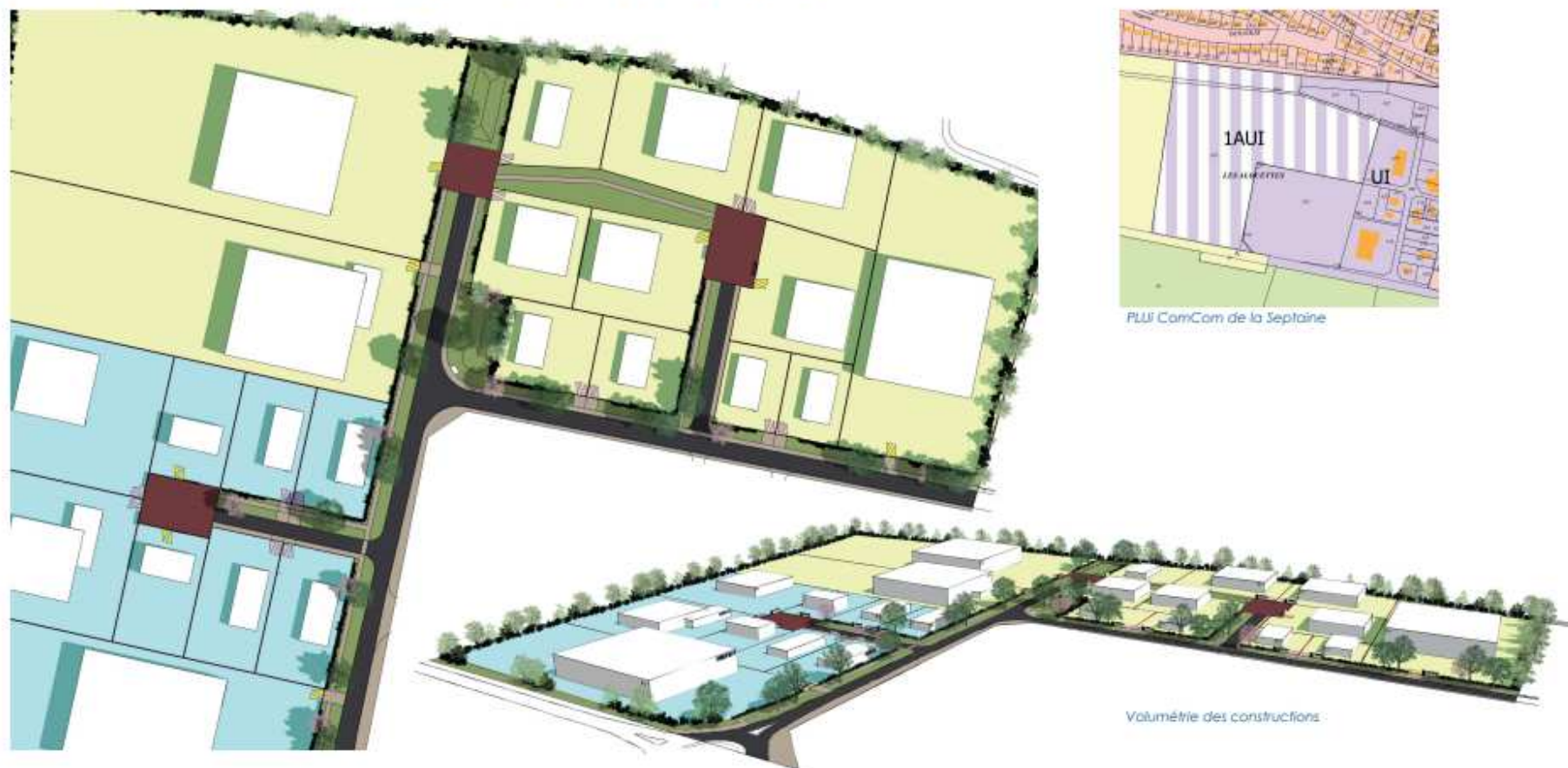
PLU ComCom de la Septaine